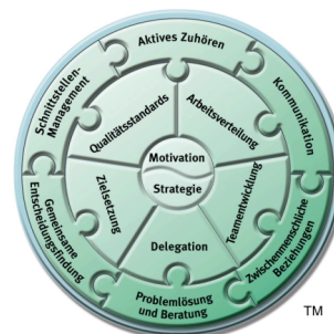
Das Linking Skills Modell Teamführung durch Sozialkompetenz